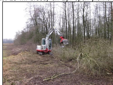
Figuur 2. Creëren van open plekken in bosranden.

Begin 2012 heeft er bosrandbeheer plaatsgevonden (tot 25 m. breed) en zijn open plekken gecreëerd (ca. 50 m 2 ) in met name de zuid tot west georiënteerde bosranden (zie figuur 2). De omvang van de open plekken en de intensiteit van dunning variëren sterk. Hierdoor ontstaan zonbeschenen plekken en kiemkansen voor wilde kamperfoelie. Vrijkomend takhout is verwerkt in takkenrillen die verspreid in de bosranden zijn gelegd, ten behoeve van braamontwikkeling. Deze functioneren bovendien als dagschuilplaats of overwinteringsplek voor amfibieën. Tenslotte zijn eiken met kamperfoelie extra vrijgezet.