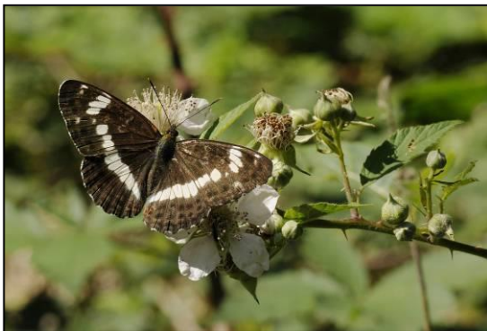
Figuur 1. Kleine ijsvogelvlinder

De kleine ijsvogelvlinder komt slechts op vijf tot zes locaties in Limburg voor. Daarmee mag de soort tot de zeldzame dagvlinders gerekend worden. Goed ontwikkelde bosranden met aanwezigheid van waardplant wilde kamperfoelie en nectarplant braam zijn een vereiste voor het leefgebied van de vlinder.