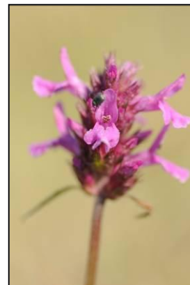
Figuur 1. Betonie is een typische 'mozaïeksoort' van heischraal- en kalkgrasland

De voornaamste bedreiging voor dit vegetatietype is verruiging en verbossing. Voor de instandhouding zijn maaien, en verwijderen van strooisel of extensieve begrazing mogelijke oplossingen. Van de soortenrijkdom profiteren vele insecten en dagvlinders, zoals bruin blauwtje en veldparelmoervlinder.