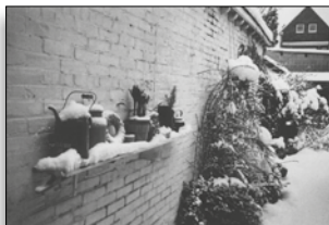
De tuin van de familie de Valk in Tilburg