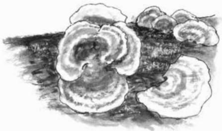
Elfenbankjes groeien op rottend hout.

Uiteindelijk blijft humus over. Humus is voedsel voor andere planten en bomen. Die groeien ervan. Dus... dood hout hoort in de natuur. Dood hout zorgt voor meer planten en dieren.