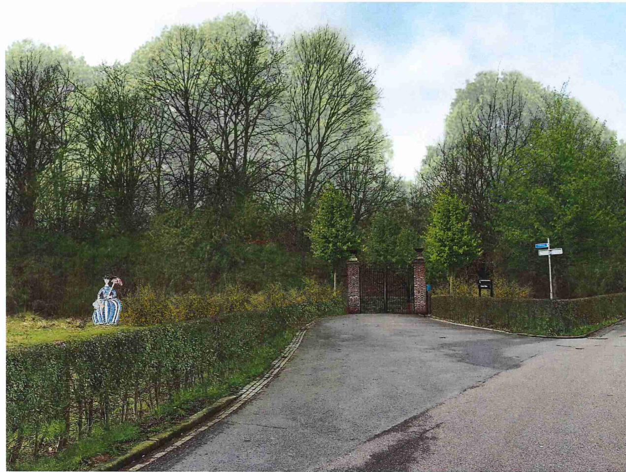
Visualisatie entree Slakweg - na aanplant