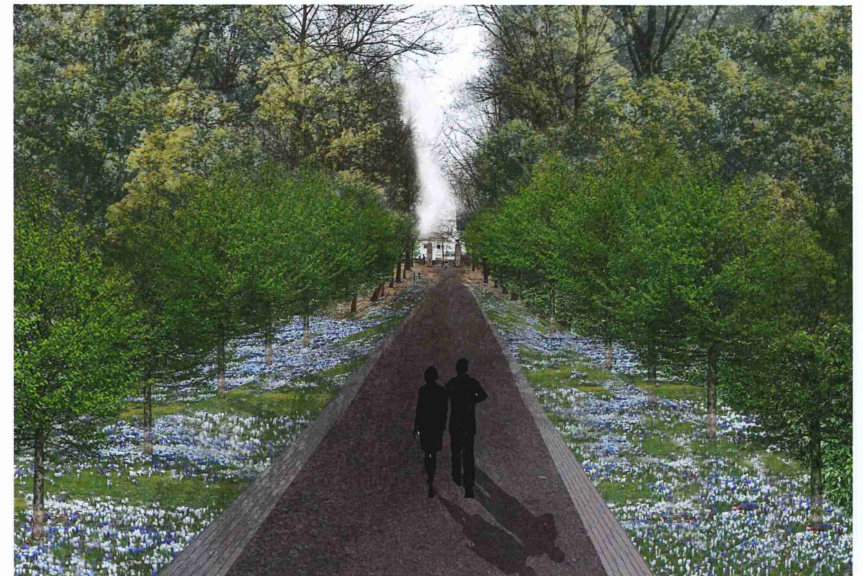
Visualisatie Slakweg na aanplant, gezien richting Kaakstraat

Beplantingstype: Onderbeplanting, vaste plant Grondsoort: humusrijke grond Bloeitijd: maart- mei Bloemkleur: wit Hoogte: 0,1-0,15m Toepassing: border, rotstuin Biodiversiteit: hommels en zweefvliegen