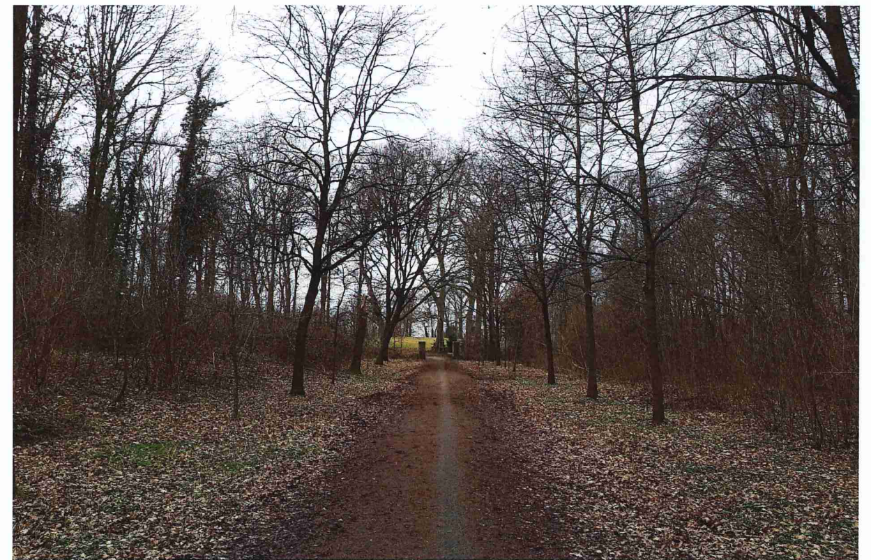
Huidige situatie bomen Slakweg, gezien richting Kaakstraat.

De huidige laanstructuur met zomereiken ontbeert als gevolg van achterstallig onderhoud uitstraling. Een inhaalslag in het beheer en onderhoud is hier intussen een gepasseerd station, omdat de bomen door scheefstand en 'misvormde' kronen geen volwaardige landgoedwaardige laan zullen vormen. Bovenstaande heeft geleid tot de keuze van Stichting het Limburgs Landschap voor het rooien van de bestaande laan en het maken van een nieuwe start. Nu de huidige bomen nog relatief jong zijn, is het vervangen van de laan minder pijnlijk dan wanneer een monumentale oude laan vervangen moet worden. Het beeld van de laan hersteld zich na nieuwe aanplant relatief snel. Ook biedt het de mogelijkheid om een goede nieuwe start te maken met beheer en onderhoud. Stichting het Limburgs Landschap heeft daarom bewust nu gekozen voor vervanging van de laan.