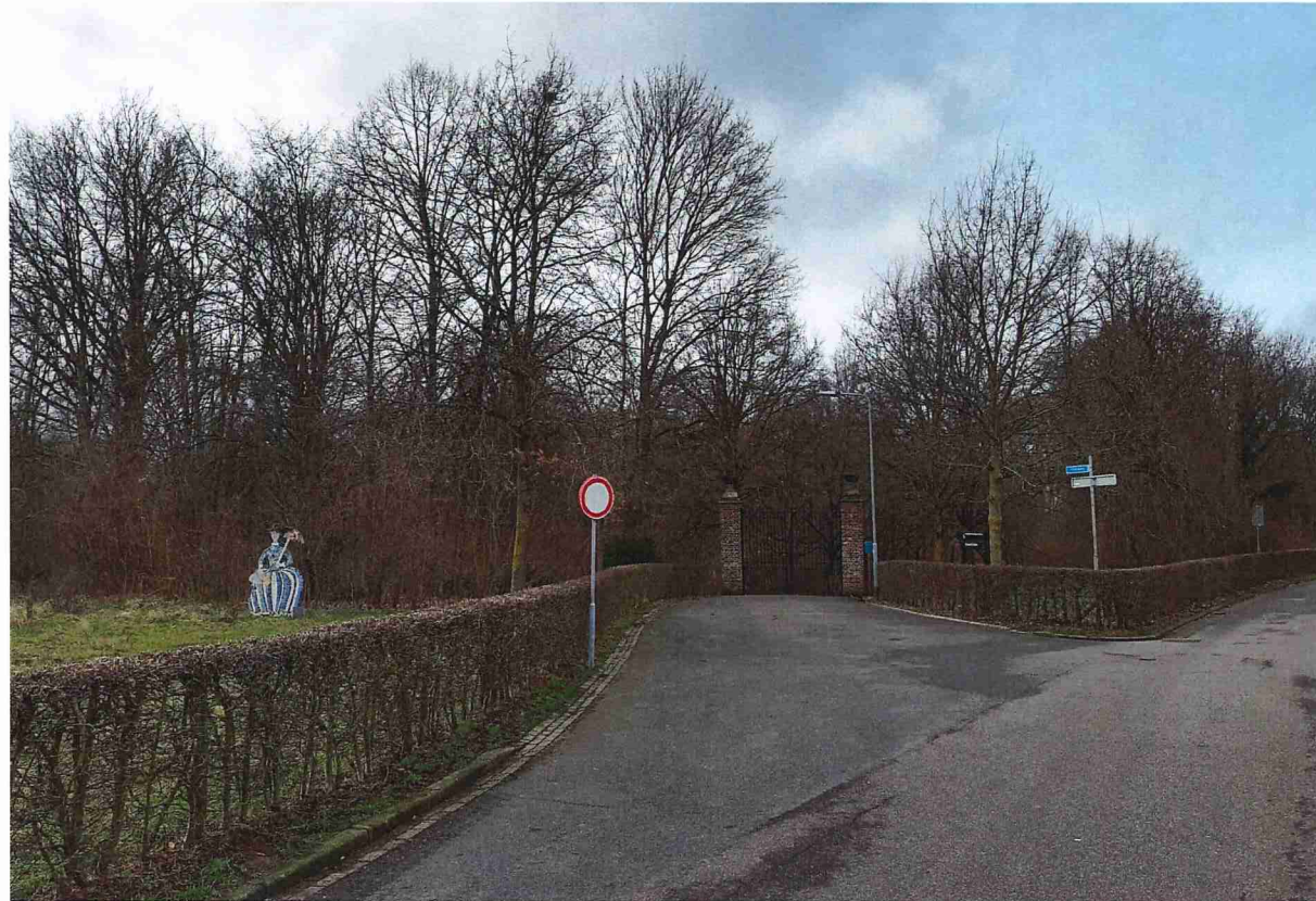
Huidige situatie entree Slakweg, gezien vanaf Kaakstraat