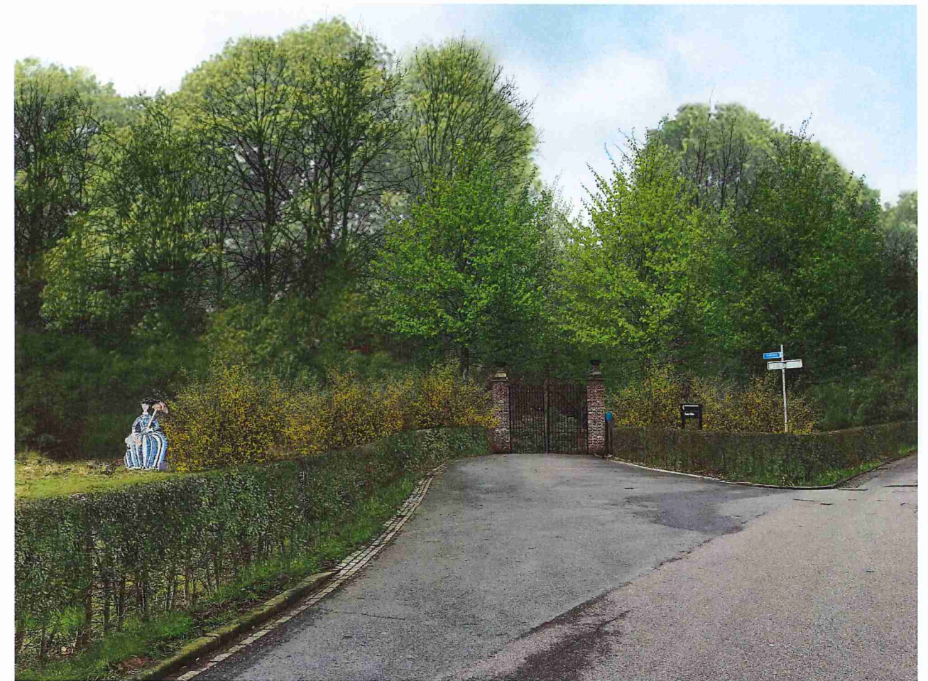
Visualisatie entree Slakweg - met volwassen beplanting

Voor de entree is gekozen om niet, zoals nu het geval is, de laan te beginnen bij de Kaakstraat, maar pas achter de poort. Dit past beter bij de uitstraling van het kasteelpark. De rand sierheesters wordt wel doorgetrokken tot voorbij de poort en vormt daarbij de representatieve inkleiding van de poort en verankert de poort in het aangrenzende bos. De beide Lindes aan de Kaakstraat kunnen daarbij gehandhaafd blijven.