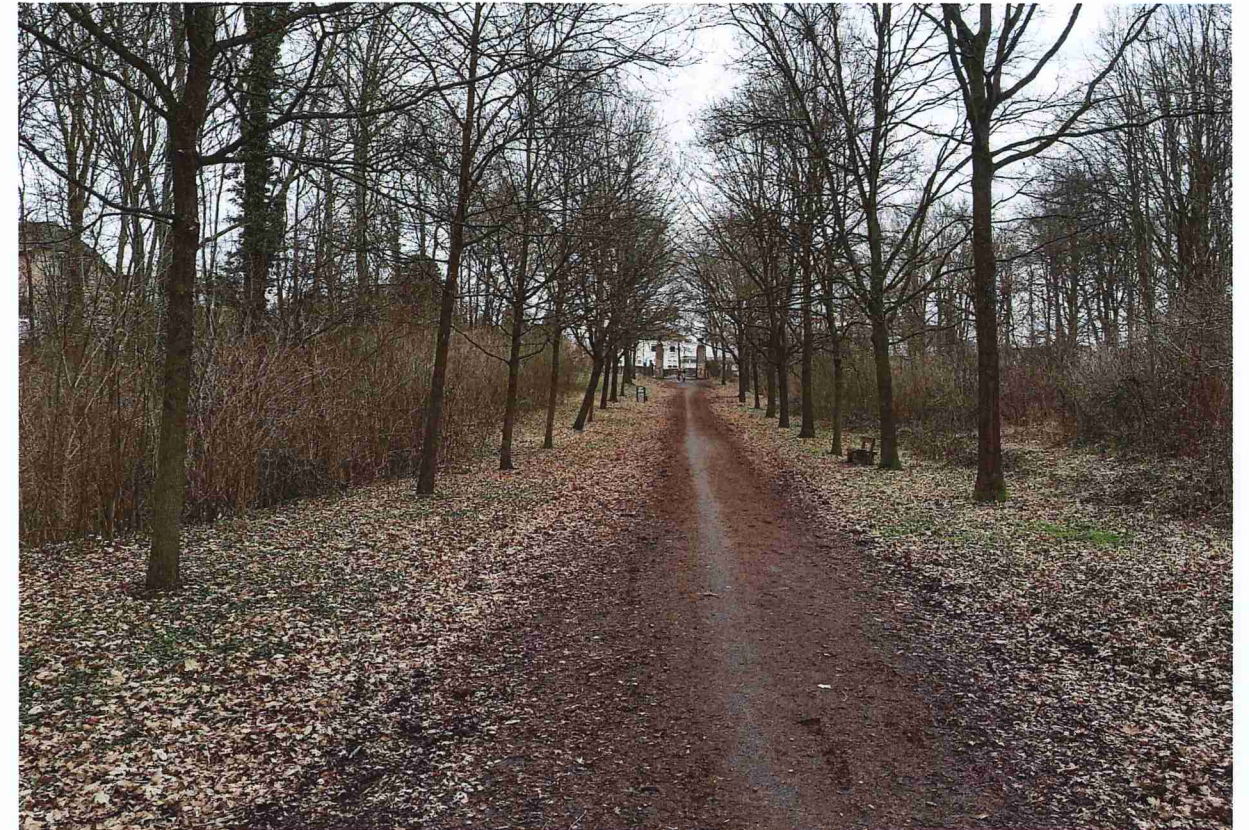
Huidige situatie Slakweg, gezien richting Kaakstraat.

De Slakweg is een in potentie monumentale laan, die de zuidelijke toegang tot het kasteelpark Elsloo vormt. Als een van de belangrijke toegangswegen tot het kasteelpark is het van groot belang dat de Slakweg een representatieve uitstraling kent. Door achterstallig onderhoud ziet de bomenstructuur echter niet uit als een in potentie monumentale laan. De bomen geven geen eenduidig beeld; ze hebben dubbele toppen, groeien scheef of hebben zware overhangende takken. Daarnaast zijn de bomen onderhevig aan lichtconcurrentie door de beplanting van de oprukkende bosrand. Hierdoor wordt de weg zowel fysiek als visueel steeds smaller en komen de laanbomen verder in de verdrukking.