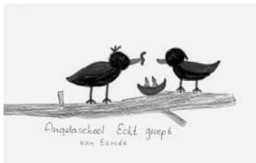
Jasmijn Smits, 5 jaar