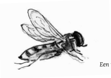
Een vliegende zweefvlieg

GA OP ZOEK naar bloemen. Kijk in een tuin, een park, langs een sloot of in een wei.