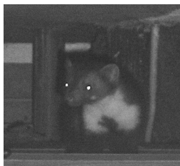
Steenmarter op zolder geflitst.