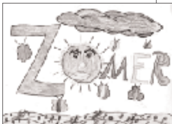
daniëlle timmermans [11 jaar]