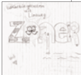
nancy smeets [? jaar]