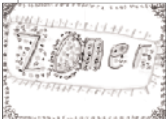
rienne vervuurt [7 jaar]