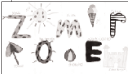
amy rings [10 jaar]