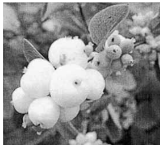
Sneeuwbesen worden ook wel klapbessen genoemd.

Tim uit Maastricht vroeg: zijn die witte, sponzige bessen die ik wel eens in mijn blaaspijpje stop ook giftig? Ja, die zijn giftig. Ze zijn van de sneeuwbes(struik).