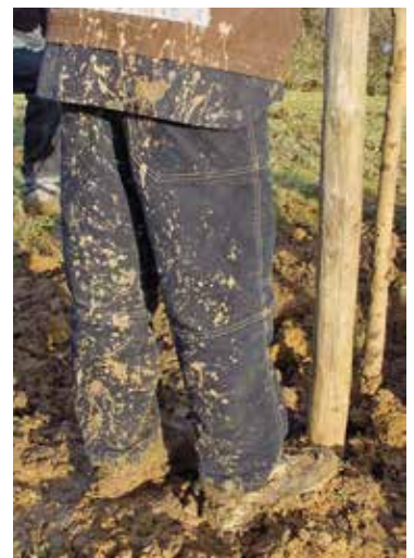
Gelukkig krijgen we altijd veel hulp uit de samenleving, zoals bij de aanleg van het Mescher Plukbos in 2003. Vele handen maken licht werk, maar ook vies.