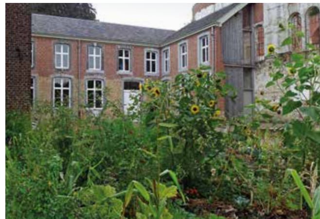
▲ In de binnentuin van Hoogcruts is dit jaar een groentelabyrint aangelegd door Pleum Moors.

www.limburgs-landschap.nl/erfgoedweekendhoogcruts/