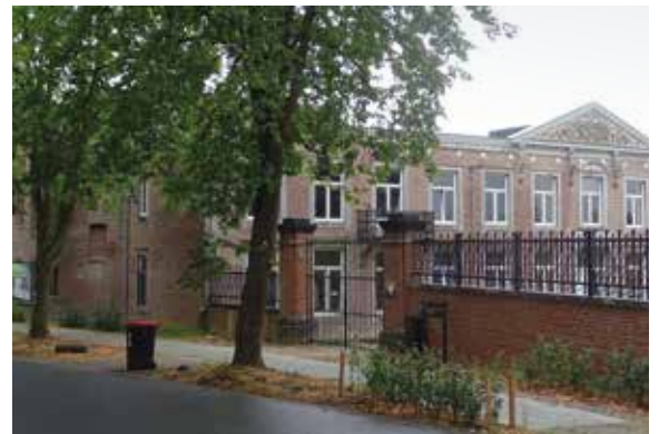
▲ Vanaf de doorgaande weg is het gerestaureerde 'kanunnikenhuis', het hoofdgebouw van het klooster, weer te bewonderen.