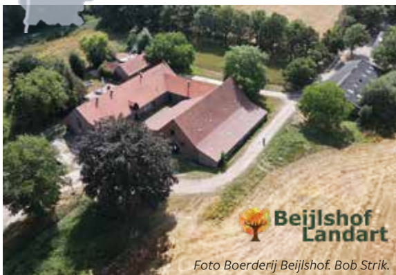
Foto Boerderij Beijlshof.