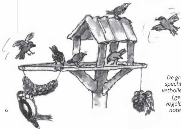
De grote bonte specht is gek op vetbollen, pinda's (geen zoute), vogelpindakaas, noten en fruit.

IN DE WINTER zijn er weinig insecten. Op haar menu staan dan hazelnoten, beukennoten, walnoten en de zaden uit dennen- en sparrenappels. Hoe krijgt ze die uit de omhulsels? Grote truc! De specht klemt een walnoot of dennenappel vast in een spleet van een boom. Ze hakt net zo lang tot ze het hapje te pakken heeft. De restjes vallen op de grond. Als ze dat steeds in dezelfde boom doet, kunnen er een heleboel opgegehakte dennenappels of andere restjes liggen. Zo'n plek heet een smidse. Kijk maar eens of je de smidse van een specht vindt.