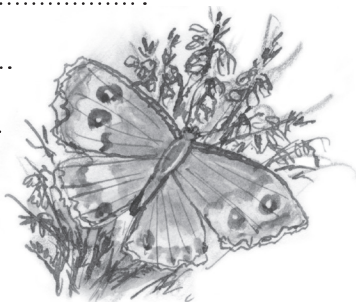
De heivlinder is grijsbruin met oranje.