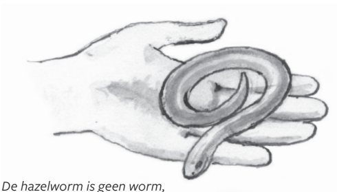
De hazelworm is geen worm, geen slang maar een hagedis!

Zie je veel gras en jonge boompjes tussen de hei? Die kunnen de hei verdringen. Dan wordt de hei op den duur een bos. Daarom lopen er vaak schapen of geiten. Ze houden het gras en de boompjes kort. Ook wordt er gemaaid of wordt het bovenste laagje van de bodem geschraapt. Zo overwoekert de hei niet en blijven er open en zonnige plekken. Lang leve de heide!