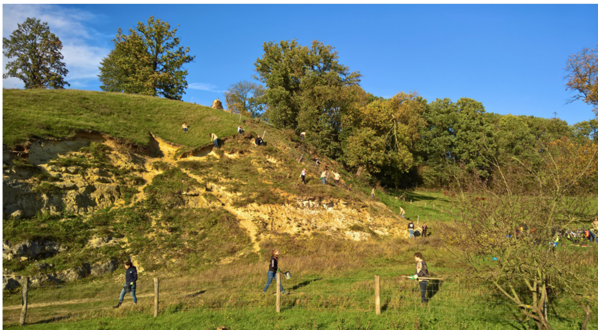
Lekker buiten bezig

In 2026 wordt de taak van vrijwilligerscoördinatie ondergebracht bij het Steunpunt Landschapsbeheer. Dat is een logische stap, gezien de nauwe samenwerking met vrijwilligers en de ervaring die aanwezig is bij het Steunpunt