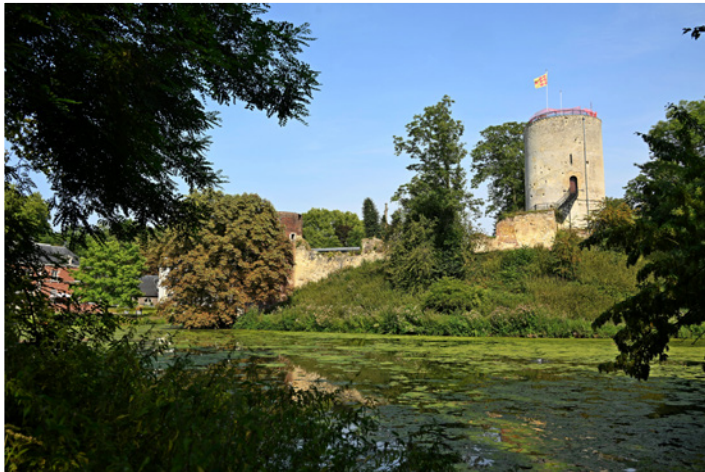
Kasteelruïne Stein: blikvanger in landschapspark

Rondom Ruïne Stein hebben we in 2025 enkele verwervingen kunnen realiseren, waarmee de basis is gelegd voor verdere versterking van het omringende landschap. Voor de Ruïne en het omliggende landschapspark hebben we een plan opgesteld en financiering geregeld. Dit herstelplan zullen we in de periode 2026-2028 in uitvoering nemen.