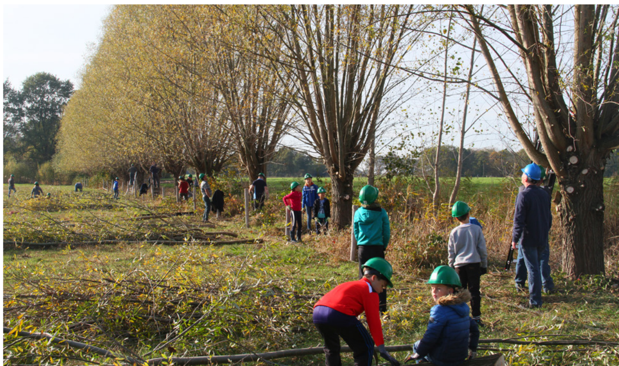
Kinderen van het landschap

Met ons cursusaanbod en activiteiten betrekken we mensen bij voor hen relevante landschapselementen en verdiepen we hun kennis. We gebruiken de aantrekkingskracht van ambachten om mensen te betrekken bij landschapsonderhoud. Ook ondersteunen we initiatieven rond oogst en creatieve toepassingen van hakhout en hoogstamrassen, en voorzien we waar nodig in certificering en opleiding.