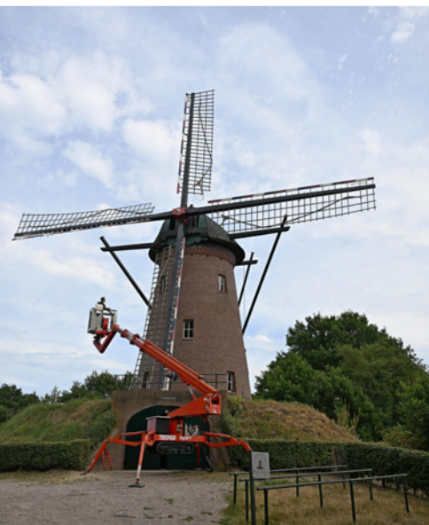
Houthuizer Molen in onderhoud