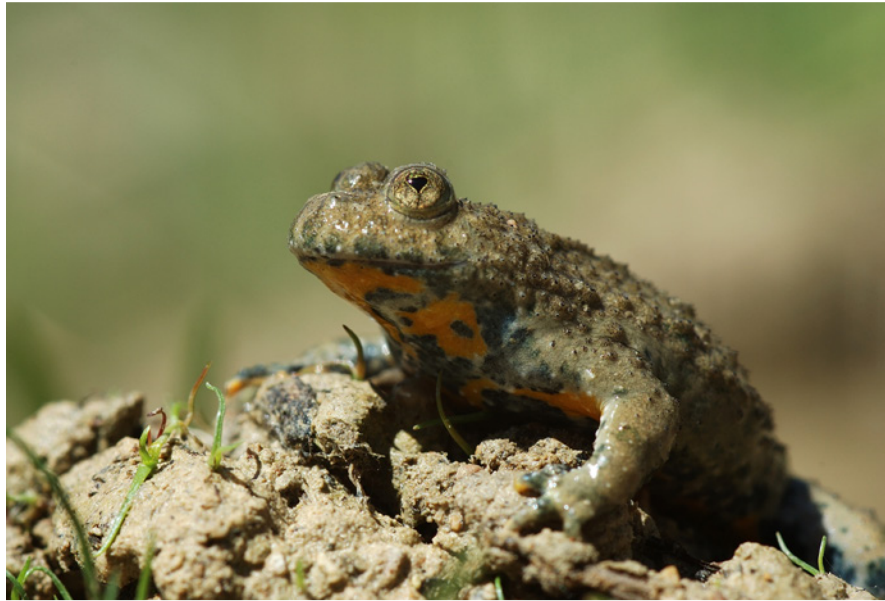
Geelbuikvuurpad: een Limburgse soort