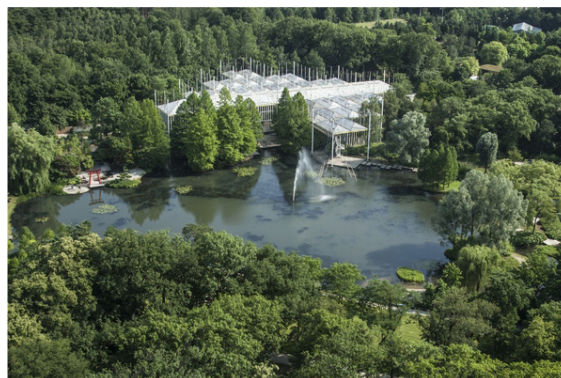
De Casa Verde moest worden afgebroken