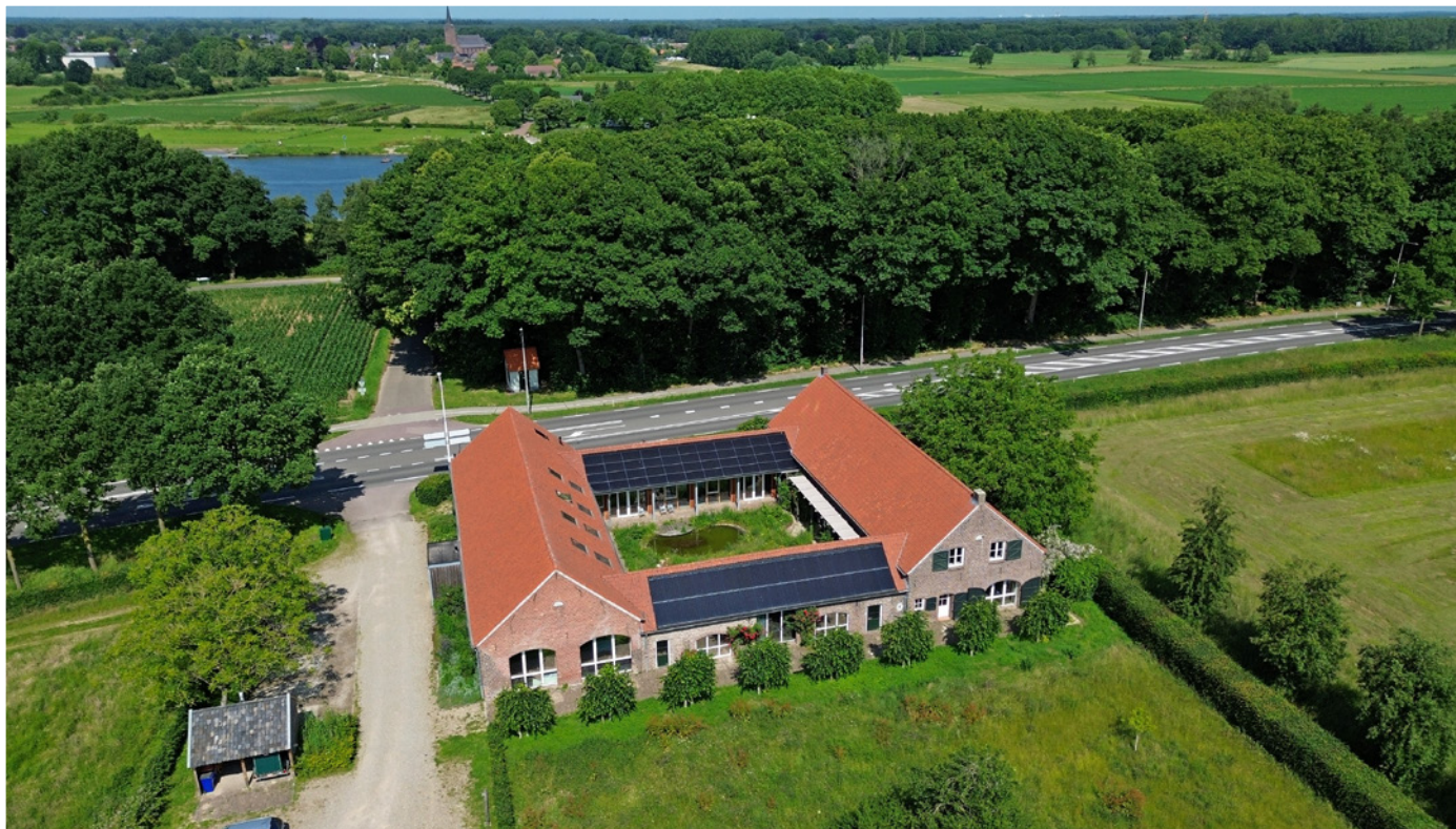
Kloosterhof: duurzaamheid troef

De kosten van onze projecten proberen we zo veel mogelijk extern te financieren. Daarvoor zijn subsidies beschikbaar, maar we kunnen ook een beroep doen op fondsen zoals de Nationale Postcodeloterij en het Cultuurfonds. Omdat we onze eigen bijdrage aan de projecten jaarlijks toevoegen aan de voorziening, heeft het jaar van afrekenen geen invloed op ons resultaat. We nemen projecten pas in uitvoering als de kosten ervan gedekt zijn. Dit gegeven maakt dit een makkelijker beïnvloedbaar deel van onze begroting: als er geen middelen zijn, gaat het project niet door of wordt het uitgesteld.