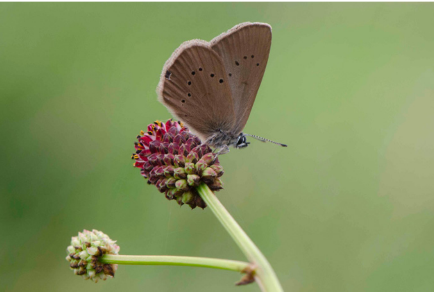
Donker pimperlblauwtje: helaas verdwenen

Onze gebieden zijn deels nog versnipperd, maar we streven in al onze gebieden zo veel mogelijk aaneengesloten areaal na. Dat is belangrijk om de waterhuishouding te kunnen aanpassen, grip op exoten te krijgen en het recreatief medegebruik te kunnen zoneren. Het is een continu proces van aankopen waarbij we grotendeels het grondaanbod volgen, begrensd door de beschikbare middelen. In onze jaarlijkse begroting willen we middelen vrijmaken om 10 ha bestaande natuur te kunnen kopen.