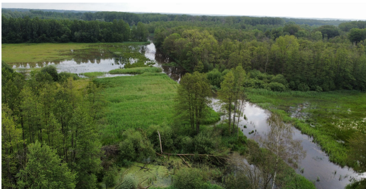
Beesels Broek: aaneengesloten eigendom maakt natuurherstel mogelijk

Onze ervaring is dat eigendom de beste vorm van bescherming is. Natuur floreert optimaal in grote aaneengesloten gebieden die samenhangend beheerd worden. Om deze redenen streeft Het Limburgs Landschap uitbreiding van de natuurgebieden na door middel van aankopen. Realisatie van het Natuurnetwerk Limburg blijft prioriteit. De Provincie Limburg heeft met ingang van het Natuurbeheerplan 2026 meer oppervlakte subsidiabel gesteld. We zullen daarbij echter een eigen financiële bijdrage moeten leveren die met de stijgende grondprijzen in omvang toeneemt. In onze begroting maken we ruimte voor 10 ha nieuwe natuur per jaar. Dat lijkt misschien weinig, maar is meer dan we de afgelopen 5 jaar konden realiseren door het beperkte grondaanbod en concurrentie op de grondmarkt.