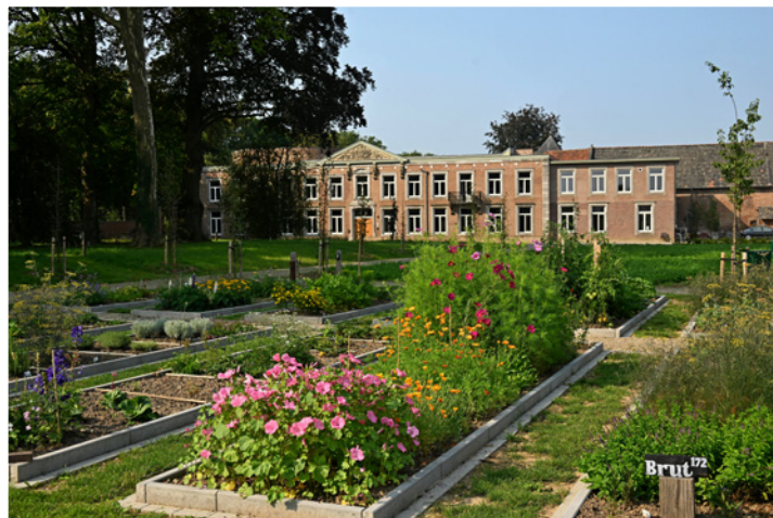
De kloostertuin bij Hoogcruts: vak voor vak verdergroeien