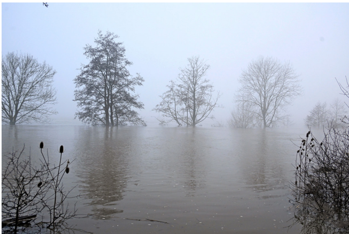
Zomerhoogwater in 2021