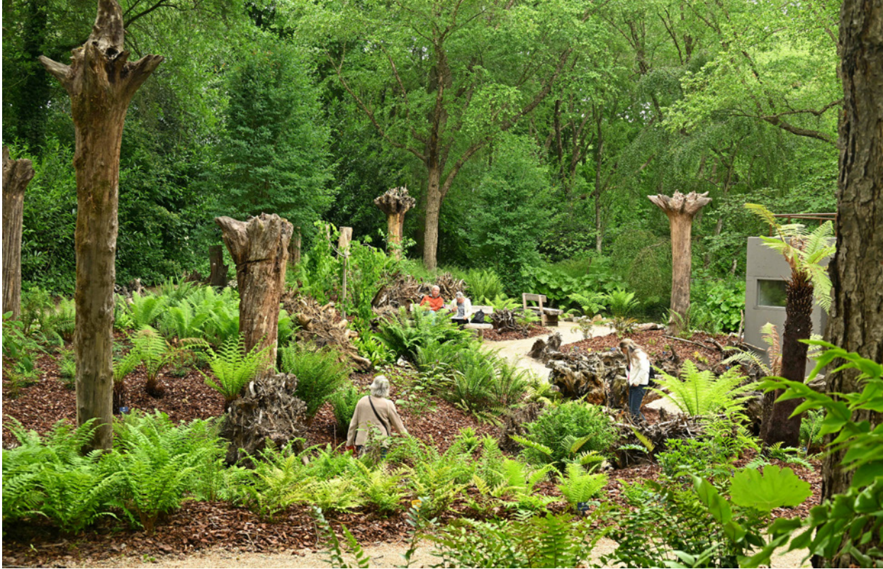
Varenvallei: kwaliteitsimpuls voor tuinbeleving

in combinatie met de tentoonstelling over 500 jaar Gilde van Arcen. Voor de ontwikkeling hiervan zoeken we samenwerking met het Limburgs Museum. Deze initiatieven sluiten naadloos aan bij de wens van de Gemeente Venlo om Arcen als bron van verhalen te positioneren als een van de drie parels van de gemeente.